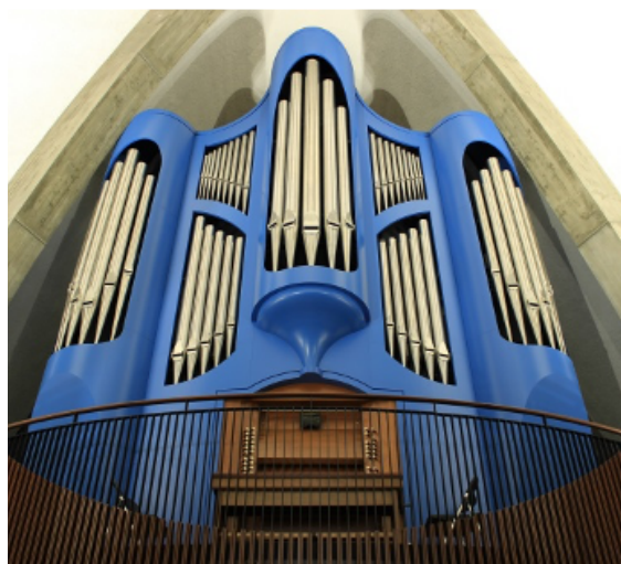
フィスクオルガン Op. 141 （2段鍵盤、ペダル付き、29ストップ）