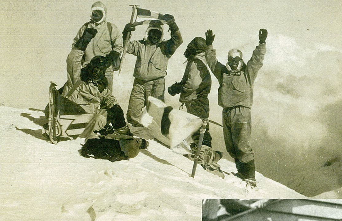
立教大学山岳部ヒマラヤ踏査隊による日本初のヒマラヤ遠征登山 [1936 (昭和 11) 年] (毎日新聞社所蔵)

●関連イベント トークイベント 10/16 (日) 11:00 ~ 12:30 東京オリンピックに出場した 校友によるトークイベントです。 場所 立教大学池袋キャンパス マキムホール MB01 教室