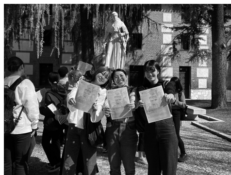
スペイン語海外言語文化研修