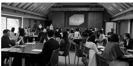
言語B横断オリエンテーション

2024年度より、英語および言語Bにおいて新カリキュラムが開始することに伴い、各言語教育研究室にて説明会やFDなどが開催されました。1月26日（木）に開催された英語教育研究室のWinter FDセミナーでは、新しい自由科目の内容の説明を、言語Bの各言語教育研究室では、担当者連絡会において新カリキュラムの説明が行われました。ドイツ語教育研究室では9月に引き続き第2回新カリFD研修を2月に開催しています。さらに、3月31日（金）には、初の試みとして、言語B横断のオリエンテーションが開催され、言語B新カリキュラムの概要や複言語複文化主義に関する説明が行われました。