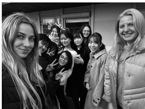
フランス語海外言語文化研修

2023年度は、英語を除く全言語（ドイツ語、フランス語、スペイン語、中国語、朝鮮語）で現地研修を実施する予定です。