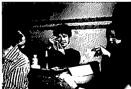
模範を見ながら、自分でメイク