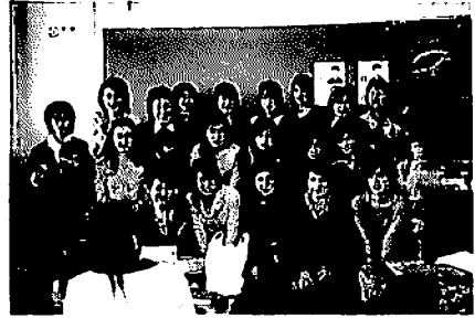
座席列別に完成記念の集合写真