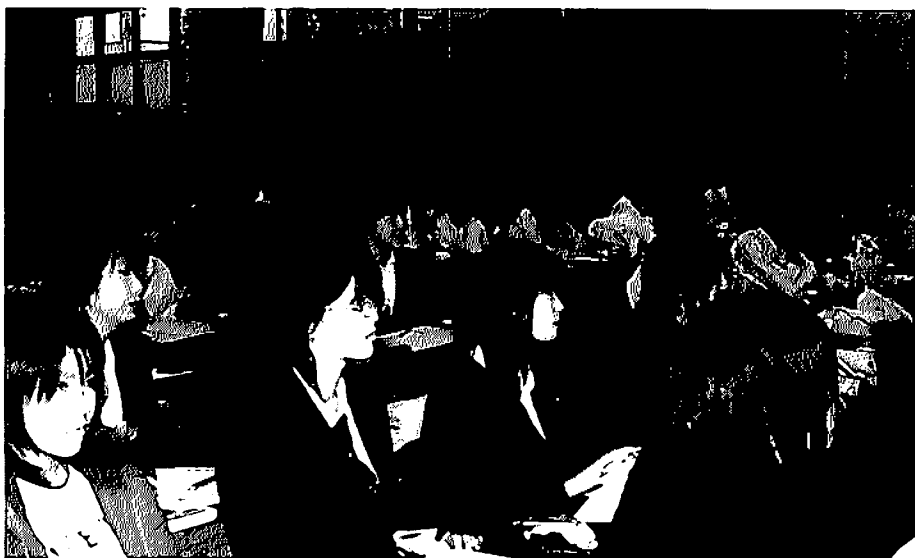
なりきりショー 真剣に評価する受講生

その一方で、病気と外見の関係を診ると、まだまだ「いのちが助かったのだから外見は我慢しろ」という風潮が残っていることは確かだ。欧米では手術で顔の一部を失うことになっても手術する前に損失した部位に対して、このような補綴物（日本ではエビテーゼと呼ばれる。義眼など）が用意できるから安心してください、というシステムができあがっているのは大違いである。眼球を失う人に対して欧米並みに外見の回復の道が提示され、外見にもその人らしさが尊重されるようになって欲しい。