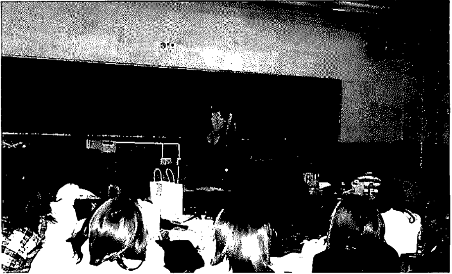
なりきりショー 男子学生が中年女性に变身

装を選ぶことになるため、必ずしも自分がなりたいと思う人物に相応しいと考える衣装ではないのである。もし、なりたい自分をモデルにできてきたなら、より日常的な実践に活かしやすいものとなっただろう。