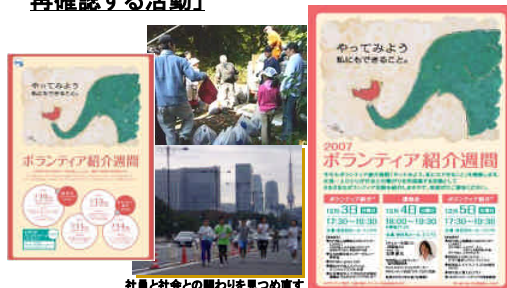
社員と社会との関わりを見つめ直す