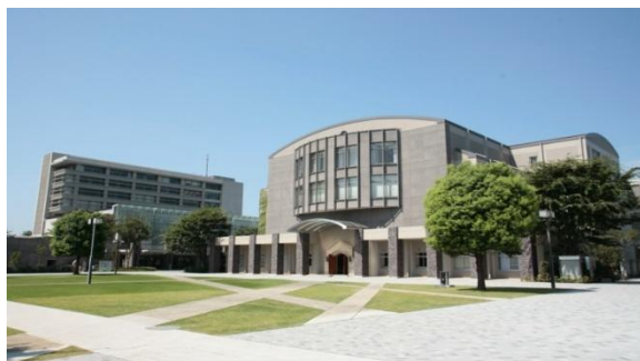
教育研究環境の整備が進む新座キャンパス