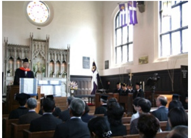
団塊世代を中心とした学びの「場」である セカンドステージ大学の開設

教育・研究については、2008年4月に異文化コミュニケーション学部、コミュニティ福祉学部スポーツウエルネス学科、現代心理学研究科映像身体学専攻が新たに開設されます。また、社会人、とりわけ急増しつつある団塊世代を中心とするシニア層に対し、質の高い教養教育と多面的な生涯学習の場を提供することが、これからの時代における本学のさらなる社会的責務であると考え、新たにセカンドステージ大学を開設します。また、学外諸機関との連携による多彩なキャリア教育プログラムの実施や、授業評価アンケート・調査分析等を通じて、さらなる教育改革・カリキュラムの改善を進め、総合的な学生発達支援の体制を構築します。さらに、リサーチ・イニシアティブセンターでは、現在推進中の様々な研究プロジェクトのマネジメント支援のほか、新たなプロジェクト型研究の創出や外部資金の獲得、産学連携ならびに地域連携の推進など先進的な研究活動を総合支援していきます。