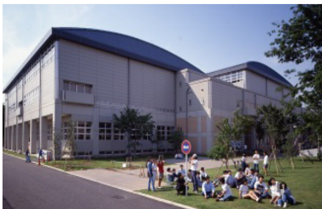
改修工事予定の新座キャンパス体育館 (1990年竣工当時の写真)