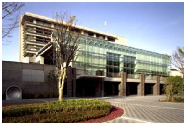
新学科開設に向け準備の進む新座キャンパス