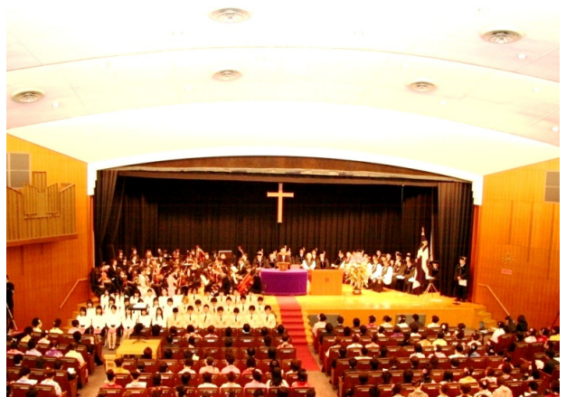
耐震補強対策を計画しているタッカーホール

財務面では、新座キャンパスの本格稼働に伴う維持管理経費増や新たな学部・学科の開設準備のための支出が先行するため厳しい財政運営が続きますが、業務の見直しやアウトソーシングへの取り組みにより財源を捻出するほか、外部資金の積極的な獲得を行っています。また、将来の環境整備や財政基盤の強化のため各種引当特定資産ならびに第3号基本金への積み増しを継続的に進めます。