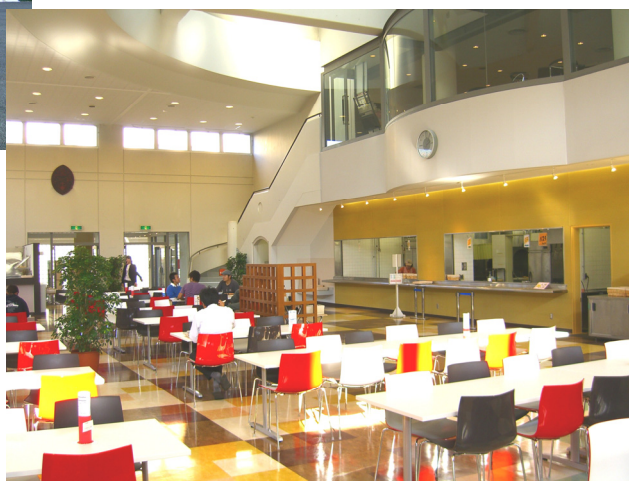
リニューアルした新座キャンパス学生食堂