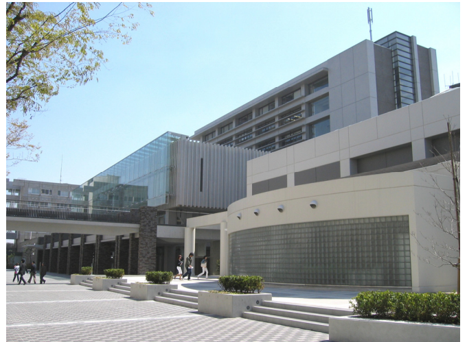
新座キャンパス(新築の研究棟・新図書館およびリニューアルした学生食堂)