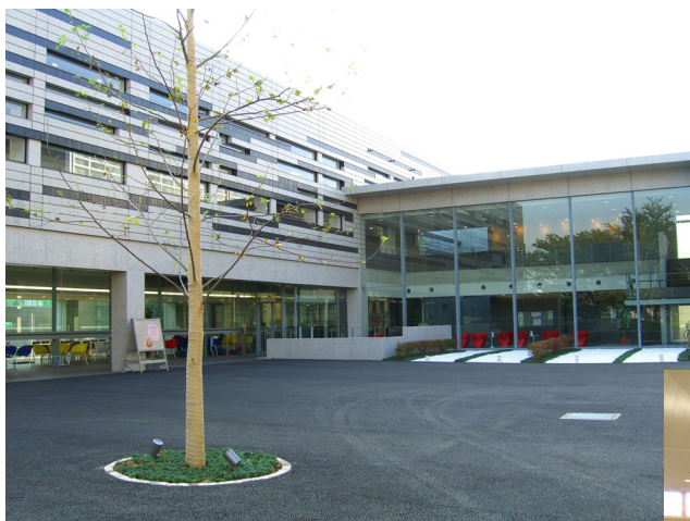
ユリの木ホール(学生関係施設)